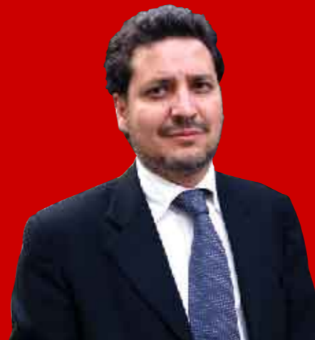
Article publicat al diari El Mundo, 28 de desembre de 2008

Pido de antemano disculpas por el tono moralista y de sermoneo de este escrito, pero son pocas las oportunidades que tengo de expresarme en un medio tan hostil a nuestras pretensiones. Agradezco la oportunidad que se me da de dirigirme a un público exigente con mis palabras, aunque espero que no intransigente, por cuanto a nuestras ideas y pretensiones se trata. Espero no herir sus sentimientos ni decepcionarles en demasía. Pido también, si no es demasiado pedir, un